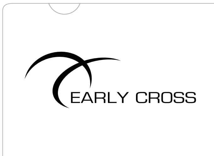
▶ 白版レイヤーにホワイト色のロゴ部分をスミ版で作成。