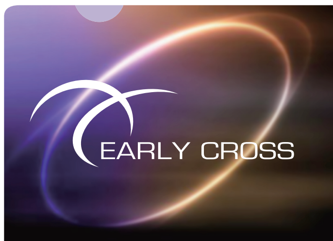
▶ ログだけを白く画像部分は半透明に仕上げたい。